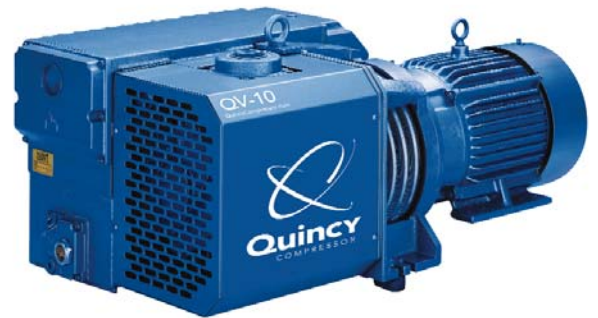
Vacío Quincy QV-10

El nivel de sonido se ha convertido en una consideración extremadamente importante en los equipos giratorios. Las bombas de vacío de la serie QV se diseñaron para funcionar silenciosamente a fin de poder instalarse cerca de personas en lugares de trabajo.