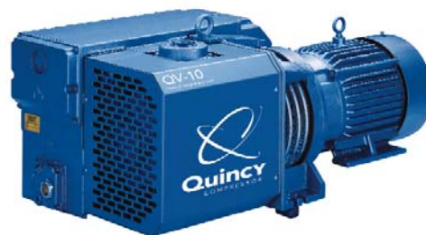
Vacío Quincy QV-10